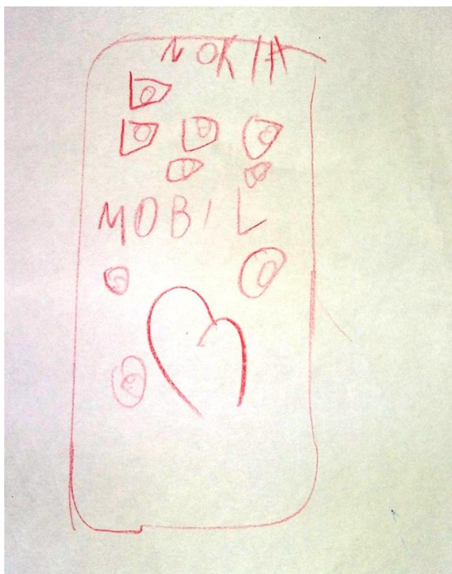
Obrázok č.4 Začarovaná rodina